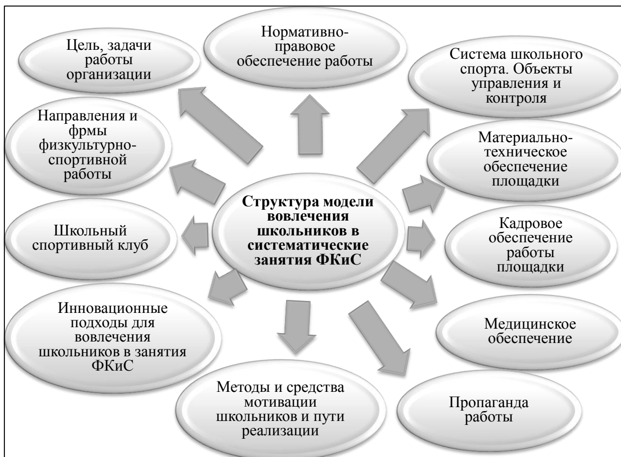
Рисунок 1. Структура модели вовлечения школьников в занятия физической культурой и спортом, на основе анализа опыта работы ранее действовавших модельных площадок в регионах РФ

Для вовлечения школьников в систематические занятия ФКиС рекомендуется нижеуказанная модель (рисунок 1).