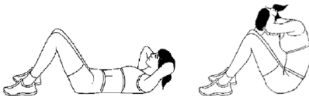
Рис. 2. Поднимание туловища