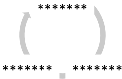
Рис.1. Название рисунка